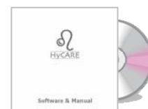
手册 & 软件光盘